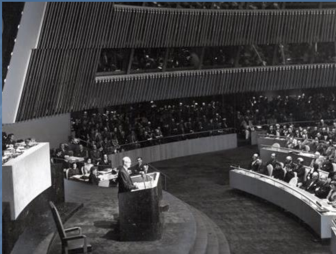
Az ENSZ Közgyűlése – 1950-es évek