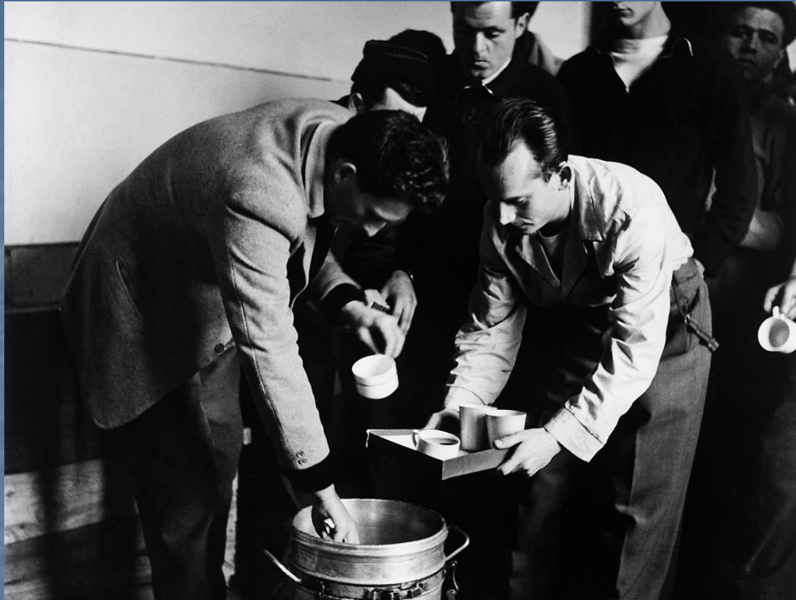
A menekültek ételmezése