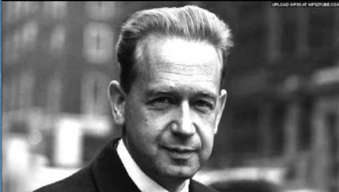
Dag Hammarskjöld, az ENSZ főtitkára (1953-1961)