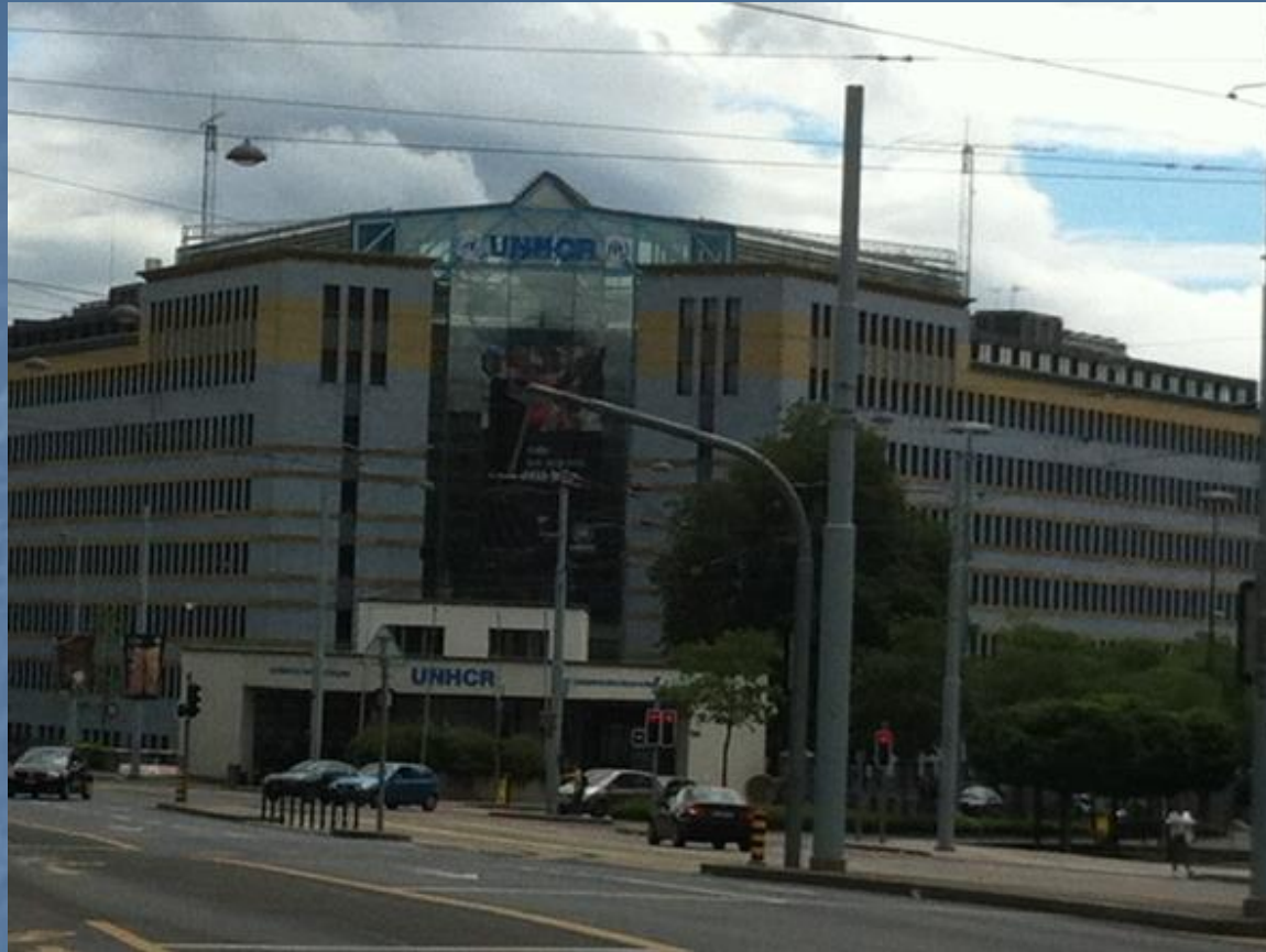
UNHCR Székháza (Genf)