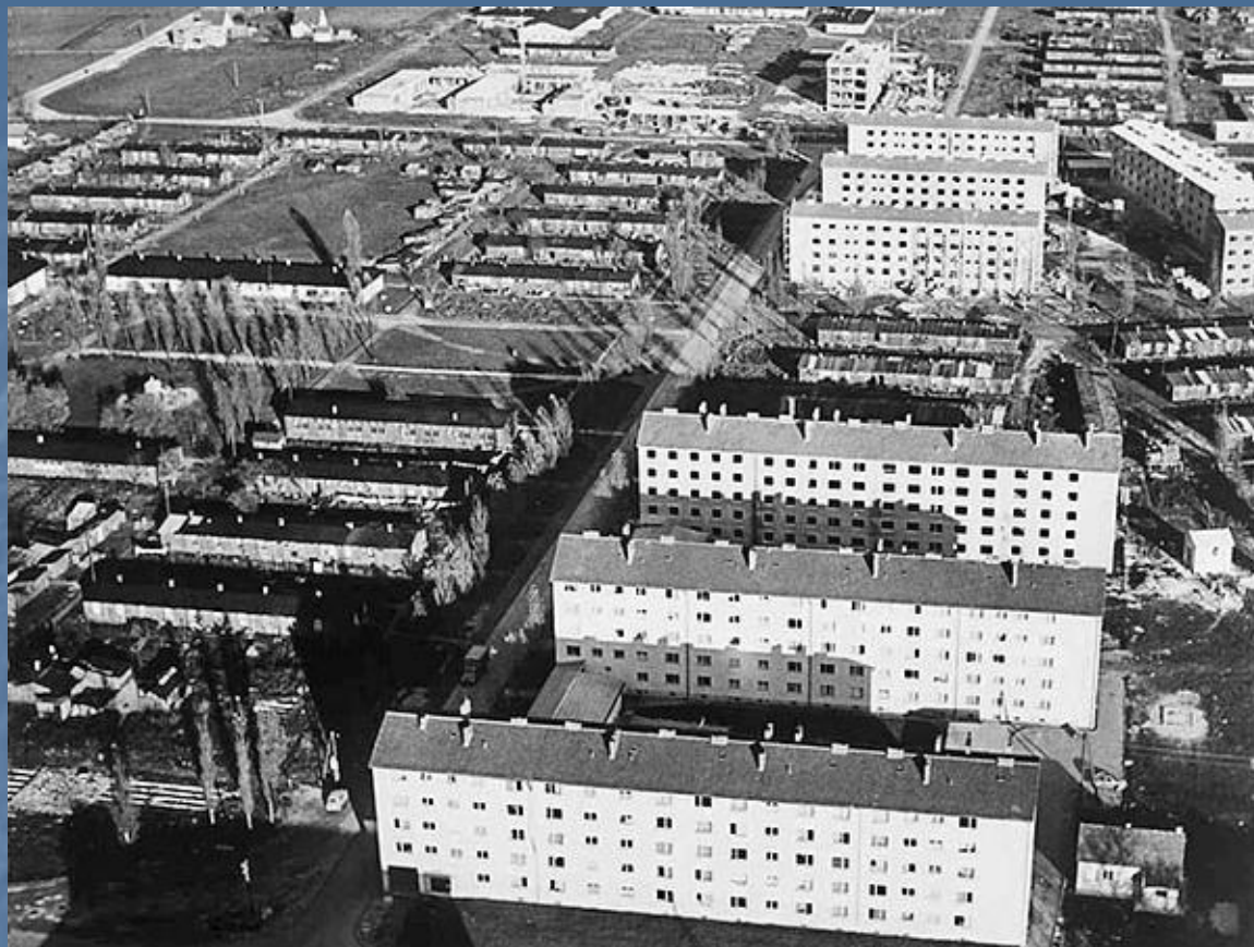
Menekülteknek épített lakótelep Ausztriában