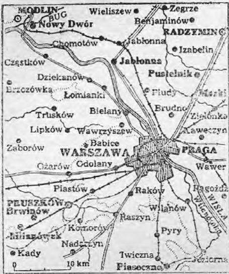
VARSO ÉS KÖRNYÉKE