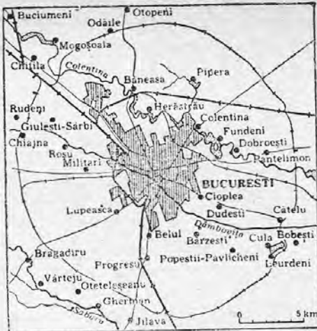
BUKAREST ÉS KÖRNYÉKE