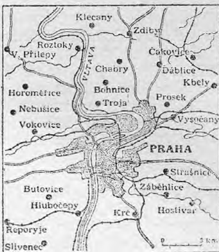
PRÁGA ÉS KÖRNYÉKE