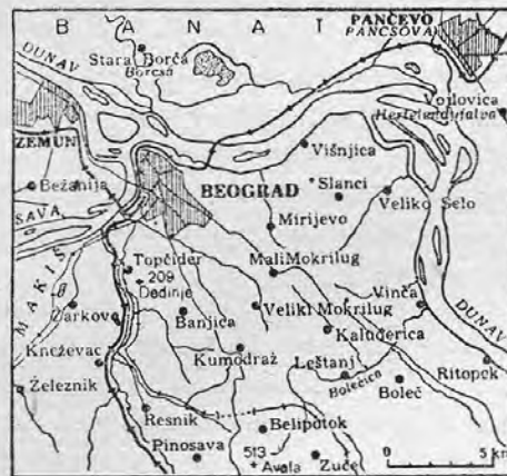
BELGRÁD ÉS KÖRNYÉKE