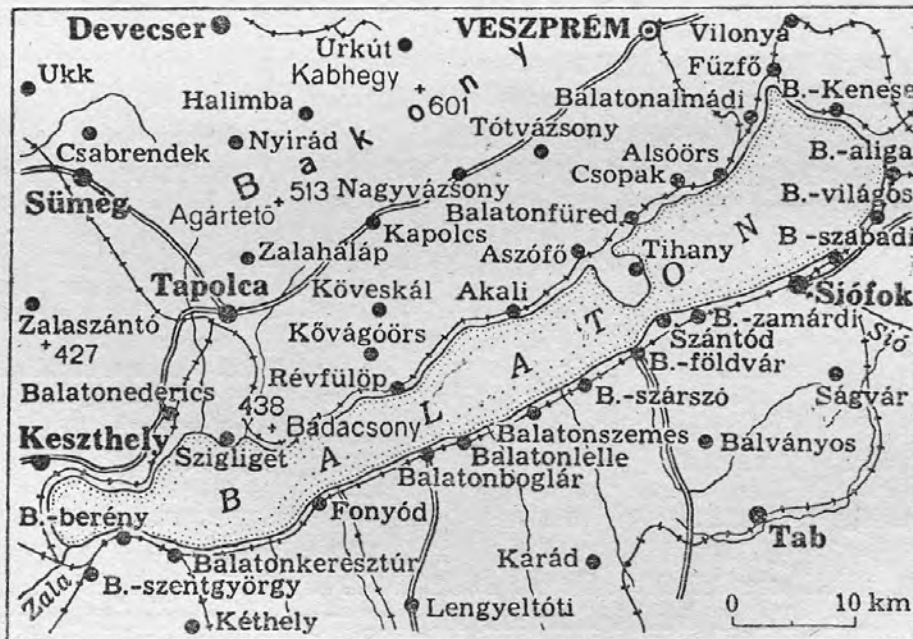
BALATON ÉS KÖRNYÉKE