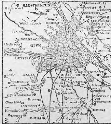
BÉCS ÉS KÖRNYÉKE