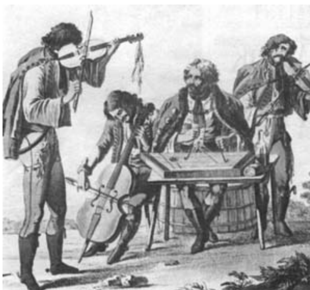
Cigány banda ábrázolása a XIX. század elején.

sodás által feltételezett... történelem valójában egyetlen civilizáció sajátos útja. Az emberiség egy korlátozott részének egyedi történelme ez... csak az a meggondolt (és ésszerű) történelem, amely egy szép napon minden vademberből becsületes alattvalót fabrikálna... A primitív társadalmak számára felkínált egyetlen lehetséges fejlődési mód a felvilágosodás Európájának útja volt... 114 Az államvezetés tehát a szabályozással az általa elképzelhető egyetlen utat kínálta fel a cigányoknak – vagy inkább kényszerítette őket, hogy rálépjenek arra az útra.