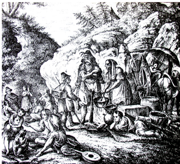
Pihenő cigány csapat. Lengyel fametszet 1834-ből.

délyben a cigányok száma a XVIII. század végén 35 000–40 000 között mozgott. 162 Bár az ilyen jelentős eltérések óvatosságra intenek – és ismét csak az alapkutatások fontosságát hangsúlyozzák –, talán nem tévedünk sokat, ha feltételezzük: a XVIII–XIX. század fordulóján, tehát a jelentősebb oláh cigány betelepülés előtt a Magyarországon és Erdélyben lakó cigányok száma együttesen megközelítette a százezret.