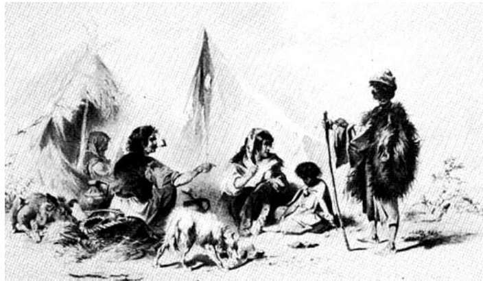
Táborozó cigányok. Rajz a XIX. század első feléből.

Mi ezekkel a véleményekkel szemben azt állítjuk, hogy forrásaink tanúsága szerint a lopás nem morális és nem is szociális probléma a cigányok esetében, hanem életmód kérdése. Fentebb a foglalkozásoknak szinte mindegyikéről sikerült kimutatni, hogy gyűjtögető jellegűek voltak. Másrészről azonban a gyűjtögetés a természeti környezetben, s másrészről a társadalmi környezetben: ez az utóbbi csak a hulladékok összegyűjtését engedte meg, minden másra a tulajdon elleni bűnnek tartott és szigorúan büntetett. Ha pedig valamiről lemondott, akkor azért legtöbbször ellenszolgáltatást kért és kapott. Igazából az az érdekes, hogy a cigányok vagy nem adtak ilyet, vagy adtak, de az nem volt reális ellenszolgáltatás. Az első esetet nevezzük tolvajlásnak, a másodikat pedig korabeli terminussal mendikációnak vagy faluzásnak.