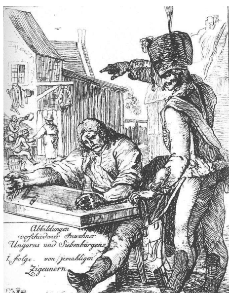
Verbunknak muzsikáló cigány cimbalmos. 1780 körül. Magyar Nemzeti Múzeum, Történelmi Képcsarnok.

Hogy mi lett a kérvények eredménye, nem tudjuk: világosan mutatják azonban, hogy mekkora igény volt a miskolci cigányok muzsikája iránt.