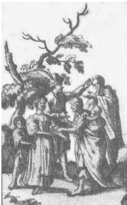
Tenyérből jósoló cigány asszony a XVII. század végén.