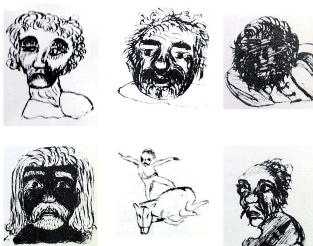
Arany János rajzai a Nagydai cigányok főbőseiről a mű kéziratából.

rendeletek preambulumaiban az előítélet csíráinak a felfedezését illeti, ezzel sem érthetünk teljesen egyet. A korábbiakban részletesen ismertettük, hogy mit tartalmaznak a rendelkezéseknek ezek a bevezetései és úgy gondoljuk, hogy semmi másról nem szólnak, csak a rendelet szükségességét mondják el a felvilágosodás szellemében, a korszakra jellemző módon (és nem utolsósorban a lépten-nyomon tapasztalható valóság alapján). Ez még nem előítélet, s nem is annak csírája – inkább akkor kellene előítéletről beszélnünk, ha azt tapasztalnánk, hogy a rendeletek végrehajtói nem tesznek különbséget cigány és cigány között.