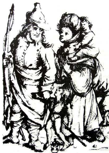
Cigány család Németalföldön, 1480 körül.

A középkori Magyarország geopolitikai helyzete eleve feltételezi, hogy a Balkán északi területei felől (ahol forrásadatokkal igazolhatóan a XIV. században már jelen vannak a cigányok) Nyugat-Európa felé (ahol ugyancsak forrásadatok bizonyossága szerint az 1410-es évektől kezdve már nagyos sok helyen feltűnnek csoportjaik, 42 ahogyan Lengyelországban is e század legelején találkozunk a cigányokra vonatkozatható első adatokkal 43 ) vezető útvonalak érintik területét. Az akár a délszláv területekről, akár a román fejedelemségekből induló cigány csoportok tehát sokkal nagyobb valószínűséggel Magyarországon keresztül jutottak el Nyugat-Európába, mint bármilyen más útvonalon, például Moldván és Lengyelországon át – bár természetesen ez utóbbi sem zárható ki. A korabeli magyar viszonyok pedig éppen annyira, ha nem jobban megfeleltek a sajátos életmódot folytató cigányoknak, mint a nyugat-európaiak. Mivel semmi okunk nincs feltételezni, hogy a vándorlás célpontjai eleve a német területek voltak (egyáltalán: cél-