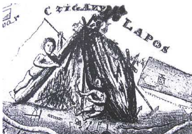
Sátra előtt dolgozó cigány kovács a szerszámaival. Rajz egy XIX. század eleji kézíratos térképről.