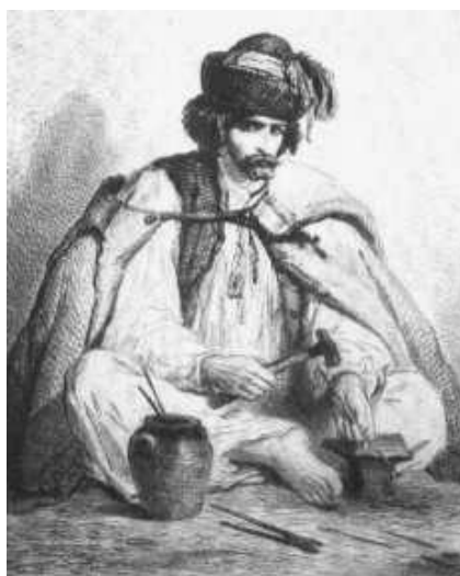
Cigány kovács munka közben. Rajz a XIX. század első feléből.

az időpontjában a beírt foglalkozás nem volt azonos a megélhetési móddal. Az alábbiakban lássunk néhány konkrét példát ennek az állításnak az igazolására.