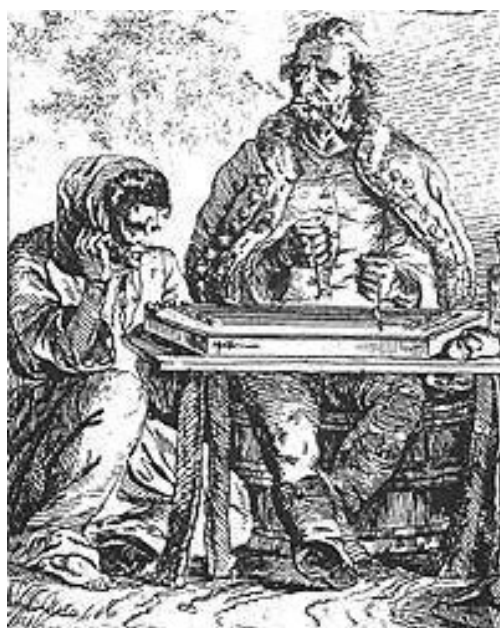
Cigány cimbalmos és felesége. Erdély, XVIII. század.

zül a Közigazgatási Bizottság feladata lett – többek között – a cigányügy gondozása is. A bizottság, amelynek munkáját Zábráczy József egri püspök irányította, tulajdonképpen nem tett mást, mint elfogadta a Mária Terézia és II. József alatt kiadott rendeleteket, valamint Fáy Pál, Torna vármegye alispánja közreműködésével kidolgozott egy tervezetet a vándor cigányok rendszabályozására. 136