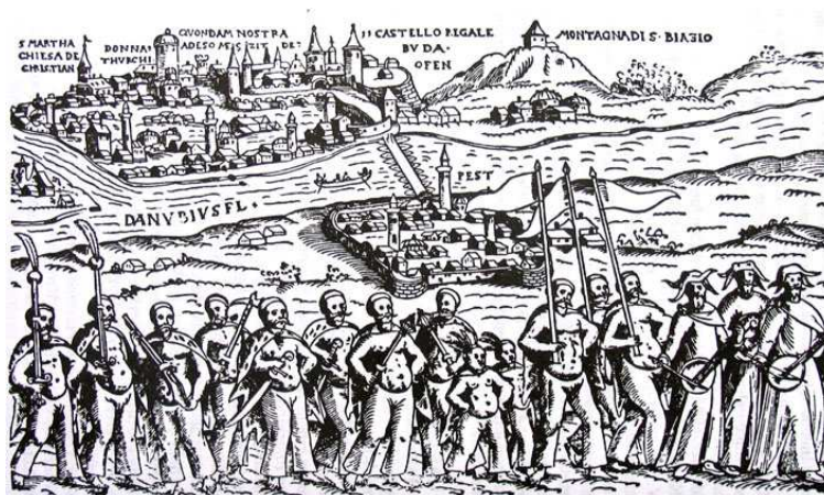
Cigány zenészek egy török csapat előtt. XVI. századi metszet.

kiadatlan. A hazai cigány történeti irodalom tulajdonképpen csak egyetlen olyan dolgozatot ismer, amelynek tárgya részben a hódoltság területén élő cigányok története. 71 Az alábbiakban ennek a tanulmánynak a lényegét foglaljuk össze.