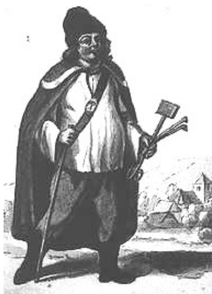
Cigány vajda XVIII. századi ábrázolása.

hogy számos olyan oklevelet ismerünk, amelyekkel a hatóságok – főleg a vármegyék – cigány vajdákat neveztek ki (ezek természetesen nem azonosak az úgynevezett fővadjai kinevezésekkel, hiszen – mint láttuk – a fővadják nem cigányok voltak és ez a tiszt javadalom-számba ment). Nógrád vármegye főispánja például 1715-ben semmisnek nyilvánítja a korábbi vétkes (megszökött a beszedett adóval) vajda kinevezését, 1720-ban pedig megerősíti „hivatalában” az alispán által kinevezett vajdát. 190 A vármegye szabott feladatot is a vajdának: eszerint az engedetleneket, káromkodókat, settenkedő lopókat és szegényt embert károsító gonosztevőket meg kellett büntetniük, vagy a megyei törvényszék, az alispán elé kellett állítaniuk, az elszökött cigányokat pedig, ha elfoghatták, ismét a saját hatalmuk alá hajthatták.