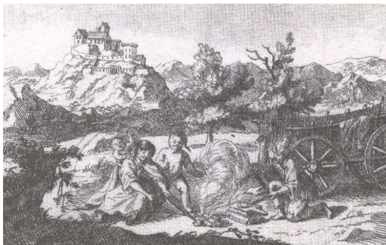
Pibenő cigány család a XVII. század végén.

Ha elfogadjuk, hogy a történelem tárgya a társadalomban élő ember (vagy embercsoport) múltja, 28 akkor eleve nagy jelentőséget kell tulajdonítanunk a társadalom megismerésének. Különösen érvényes ez a megállapítás a cigányság esetében. Ha ugyanis általa létrehozott történeti források nem léteznek, a külső források pedig egyrészt (bár nem kiigazíthatatlanul) torzítanak, másrészt jellegükből következően csupán szórványadatokat tartalmaznak, akkor csak egyetlen dolgot tehetünk: a szociológiai és antropológiai kutatások által megismert mai cigány társadalom múltbeli előzményeit próbálhatjuk felfedezni a szórványadatok alapján. Vagy más szavakkal: a mai társadalom ismerete alapján kell feltennünk a múltba vonatkozó kérdéseinket, s ezekre kell a válaszokat kicsikarnunk a múltbeli tényektől, amelyek forrásainkban fellelhetőek.