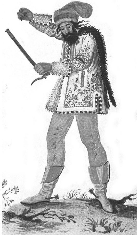
Edélyi cigány vajda a XVII. század végén.