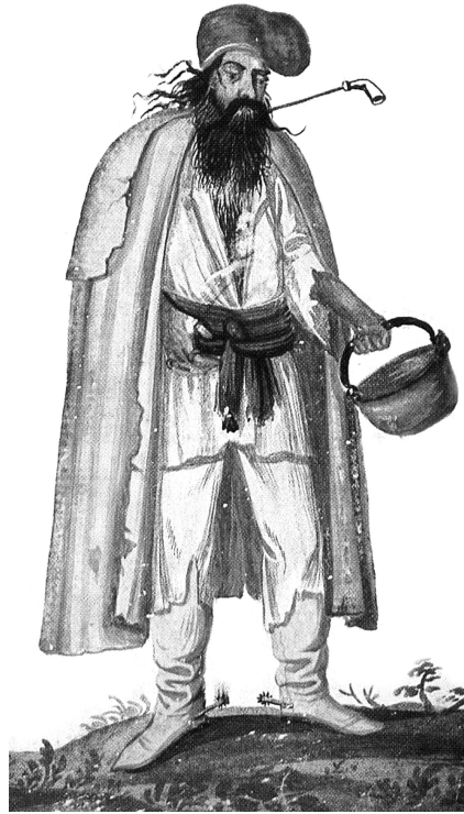
Erdélyi üstfoldozó cigány a XVII. század végén.