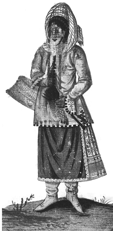
Erdélyi cigány asszony a XVII. század végén.

magukat, valamint olyan árucikkek összeszedéséből és eladásából, amelyeket oroszya szereznek meg. Görög vallásúaknak állítják magukat, amikor a keresztények uralma alatt vannak; egyébként pedig pogányok, vagy – ahogyan mondani szokták – vallás nélküliek: nincsenek ugyanis istenszobraik. Tisztelnek azonban egy istenséget, de pogány szertartás szerint.