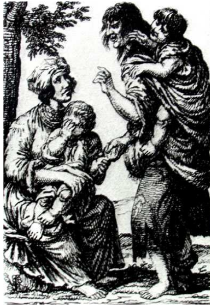
Tenyérből jósoló cigányasszony. Kajetan W. Kielisinski rajza 1841-ből.

meg nem fogja, és hogy fíve is volna néki olyan, hogy nem félbet ő semmitül semmit. 258 – A kassai seborvos egyébiránt nem találta nyomát a mérgezésnek és a gyanús szerről is, ami az asszonyoknál talált dobozban volt, kiderült, hogy csak törökbors (piper Turcicus).