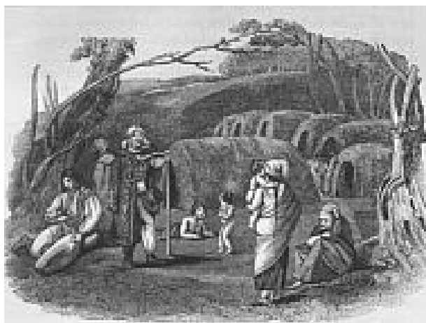
Cigány tábor, 1818. Metszet Bright útleírásából.

A történész feladata lenne, hogy megpróbálja megtalálni a ma körvonalazható foglalkozási, nyelvi, nemzetségi 193 vagy bármilyen más csoportoknak az előzményeit. Erre tettünk is kísérletet fentebb a három nagy nyelvi csoporttal (a magyar, az oláh és a beás cigányokkal), illetőleg ezen belül bizonyos foglalkozási csoportokkal (fafaragók, rézművesek) kapcsolatban. Ami azonban a többit illeti, éppen úgy a sötétben tapogatózunk, mint annyi más esetben, hiszen a források itt is szűkszavúak, csaknem némák. Egyelőre meg kell tehát elégednünk azzal, hogy ismertetjük a tárggyal kapcsolatba hozható adatokat.