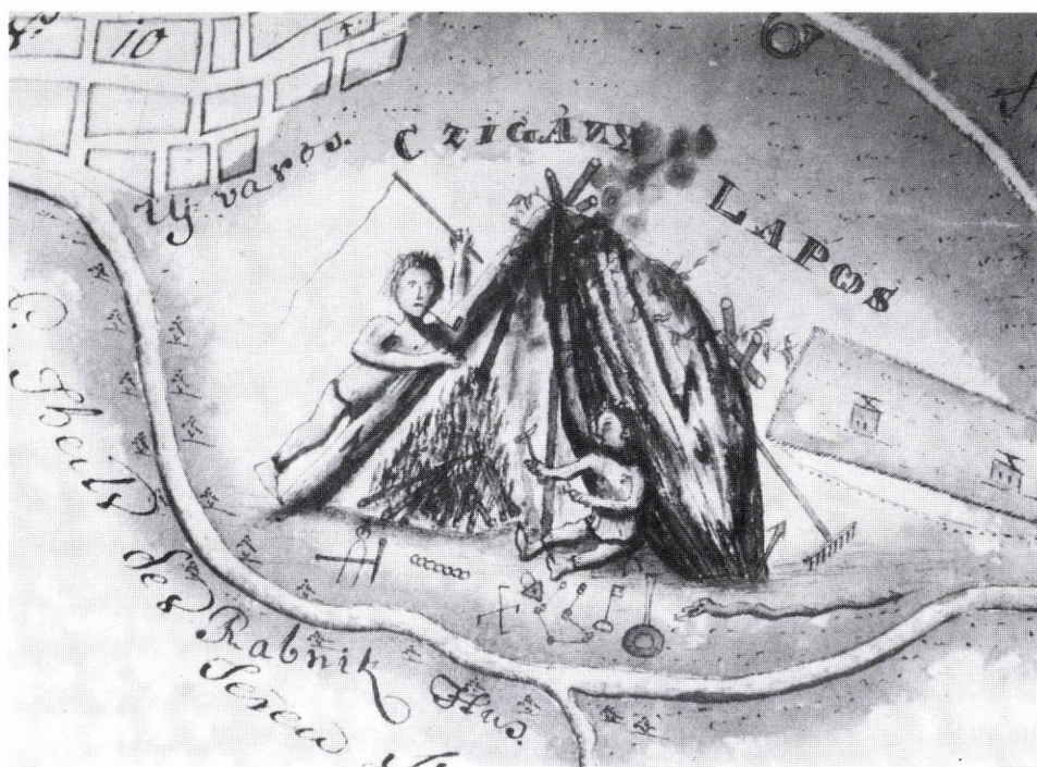
3. kép. Az 1789-es győri térkép részlete a cigányok életmódjára utaló információkkal.