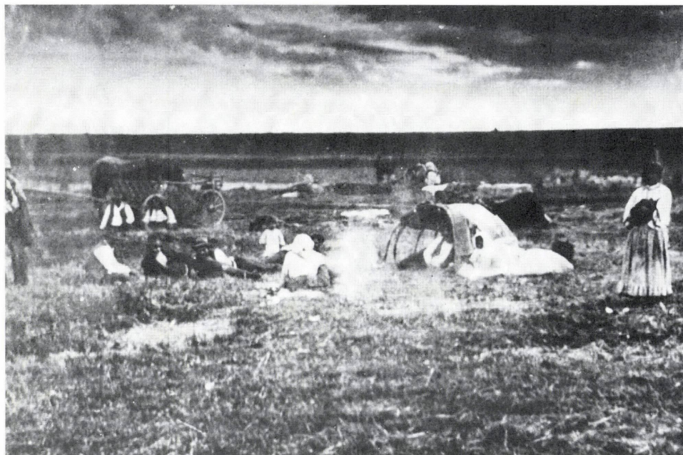
8. kép. Cigánytábor a Mákos dűlőn. Győrújváros, 1930.