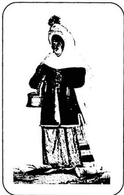
2. kép Cigány vajda felesége. Wife of a gypsy roivod Ismeretlen német mester akvarellje, 17. sz. Erdély Watercolour by an unknown German painter, 17th c. Transylvania (OSZK)