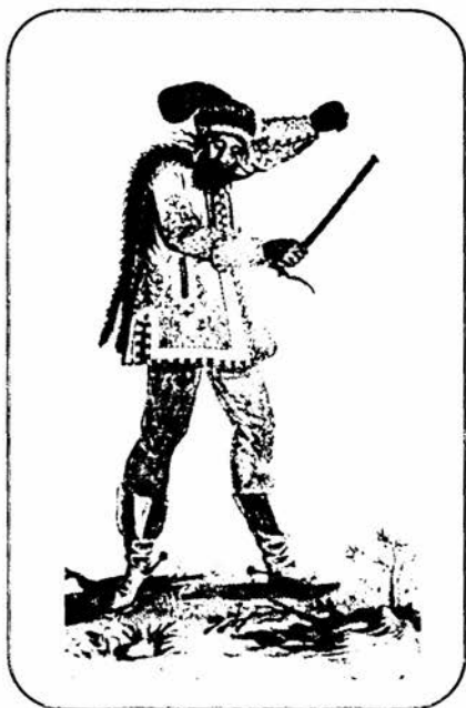
1. kép Cigány vajda. Gypsy roivod Ismeretlen német mester akvarellje, 17. sz. Erdély Watercolour by an unknown German painter, 17th c. Transylvania (OSZK)