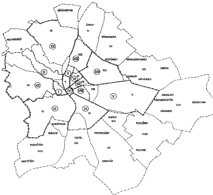
Budapest határa és közigazgatási beosztása 1950. január 1. előtt és Nagy-Budapest létrehozása után