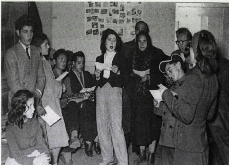
A mátészalkai cigány népi együttes próbája. (Keletmagyarország, 1957. december 8. Hammel József felvétele. Az eredeti fotó: SzSzBML. XXIII. 23. b. 12. doboz)

A rögtönzött és a gyermekek számára felejthetetlen ünnepség keretében a tanulók egy-egy új pár cipőt, továbbá édességsomagokat kaptak. Az ajándék átadása közben a krampuszok még a gyerekek jó és rossz tulajdonságait is elmondták.