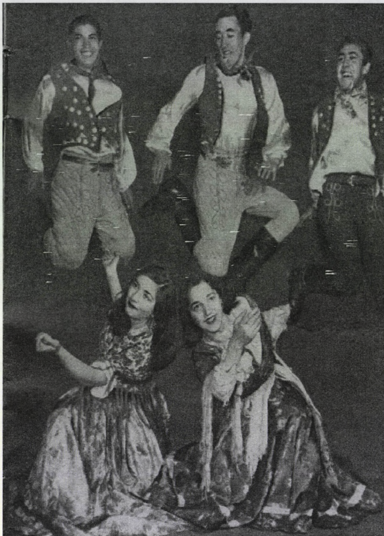
A mátészalkai cigány népi együttes előadása (Ország-Világ, 1958. február 2.)